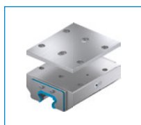
Série KWH Elément de serrage