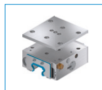
Séria UBPS Upínací a brzdový prvok