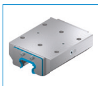
Séria KBH Upínací a brzdový prvok