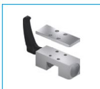
Série HK Élément de serrage