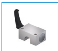
Série HKR Élément de serrage