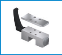
시리즈 HK 클램핑 요소