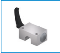
시리즈 HKR 클램핑 요소