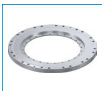
Série DKHS1000 Élément de serrage