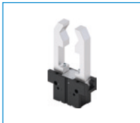
Serie GPP5000AL 2-Backen-Parallelgreifer