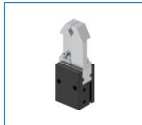
Serie MGP800 2-Backen-Parallelgreifer