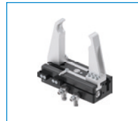
Serie GH6000 2-Backen-Parallelgreifer mit großem Hub