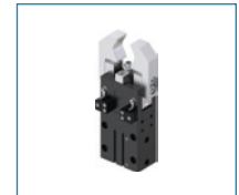
Serie GK 2-Backen-Radialgreifer