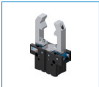
Serie GPP5000 2-Backen-Parallelgreifer