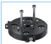
APR000017 Placa adaptadora