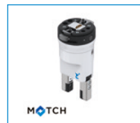
MATCH - Greifer