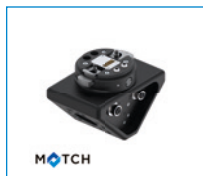
MATCH - Winkelflansch