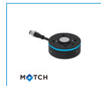
MATCH - Robotermodul