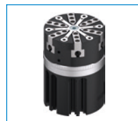
Greifer für besondere Aufgaben