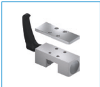
Serie HK Elemento de sujeción