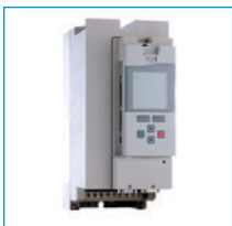
Convertidor de frecuencias