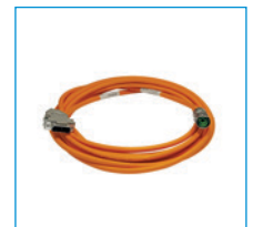
Cables de señales