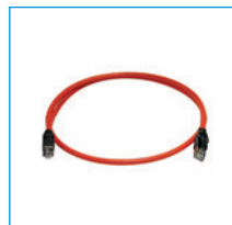
Adaptador para convertidor de frecuencias