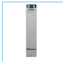
Unidades de mando