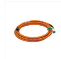
Cables de potencia