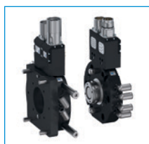
Jednostka wymiany robota