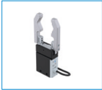
시리즈 GEP2000 2조 평행 그리퍼