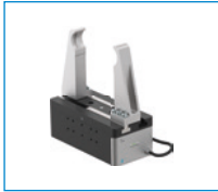
시리즈 GEH6000IL 큰 스트로크를 갖는 2조 평행 그리퍼