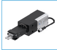
시리즈 REP2000 2조 평행 회전 그리퍼