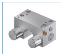
Serie MKRS Elemento de sujeción