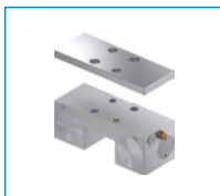
Serie MK Elemento de sujeción