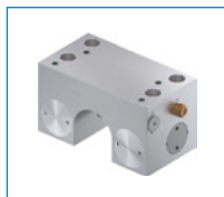
Serie MKR Elemento de sujeción