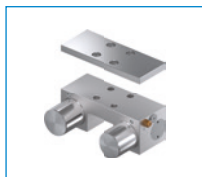
Serie MKS Elemento de sujeción