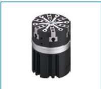
시리즈 GS O자형 링 외부 설치 그리퍼