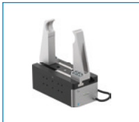
Serie GEH6000IL 2-Backen-Parallelgreifer mit großem Hub