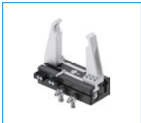
시리즈 GH6000 큰 스트로크를 갖는 2조 평행 그리퍼