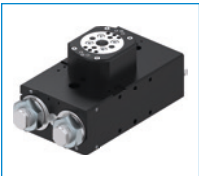
Serie SF-C Flachschwenkeinheiten