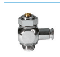
Výkyvné škrtiace spätné ventily