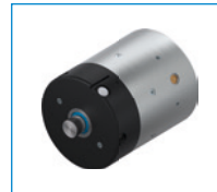
Serie RBPS Elemento de sujeción y frenado