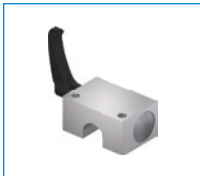
Serie HKR Elemento de sujeción