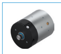
Séria RBPS Upínací a brzdový prvok