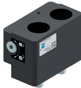
5 Część stała szczęki wymiennej