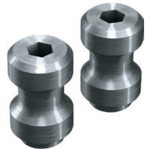
4 Zestaw elementów luźnych do szczęki wymiennej